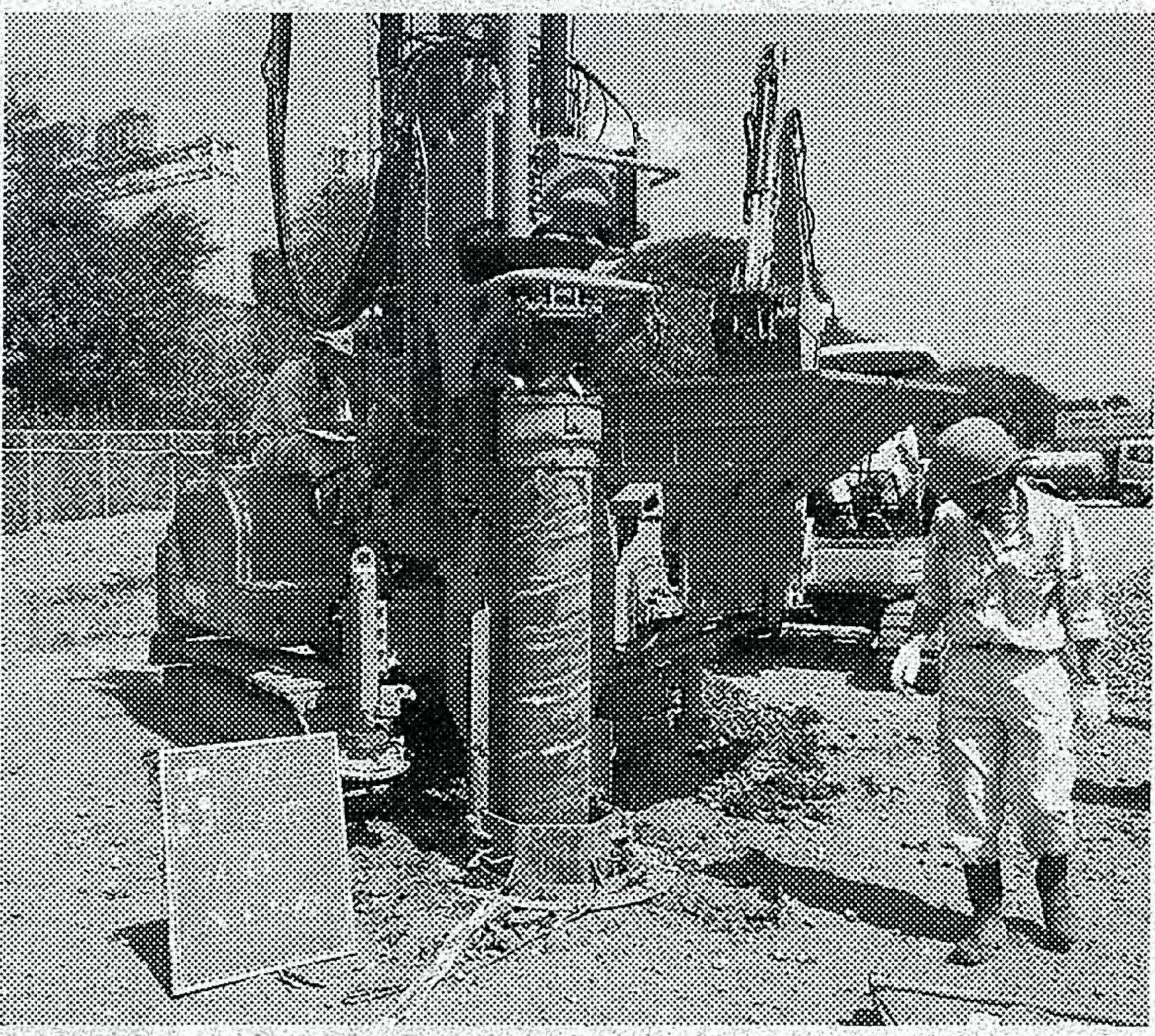
エコシオ工法で地盤を掘る

同工法は、EGケーシング(鉄の筒)を地面に対し掘った土を地上に出さず、中の土を水平方向に圧縮させることで、周辺地盤を固めながら地面に穴を開ける。掘った穴にはセメントなど人工物を埋めずに天然の砕石を埋めるため、地盤の強度を長期的に維持でき